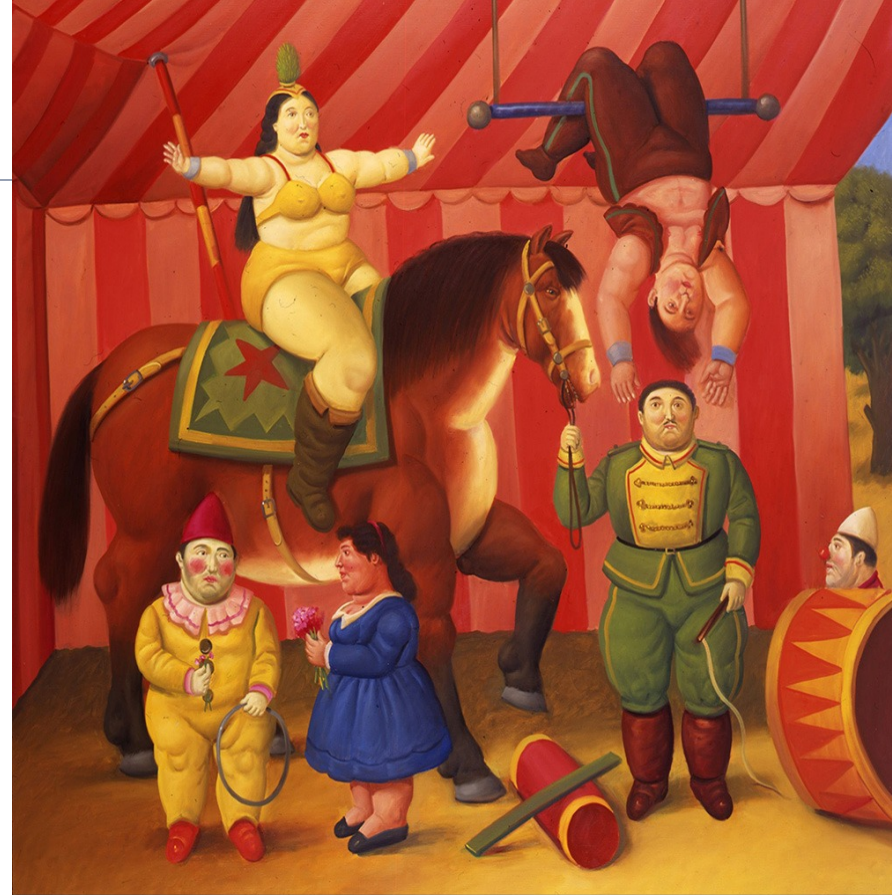
Gente del circo (2007).